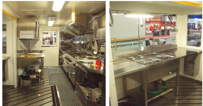
Innenansicht des Komplexes von der Eingangstür aus und Innenansicht des Systems der Raumerweiterung, mit „Herausnahme“ der Verteilung aus dem Trägerkörper, mit Plattform und Treppen