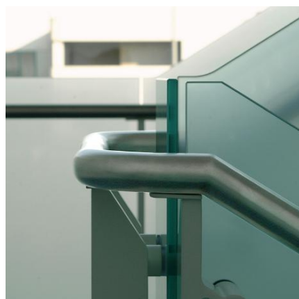
Scala Acciaio e Vetro