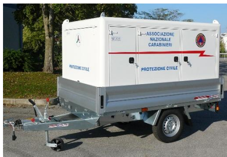
Ansicht der Einheit im Transportzustand