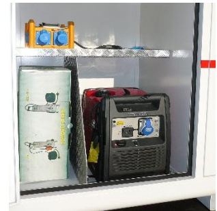
Details der Ausstattung