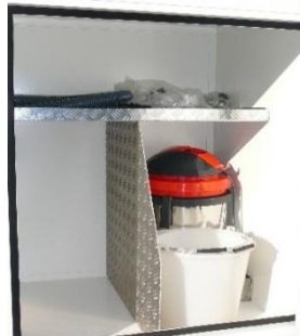
Details der Ausstattung