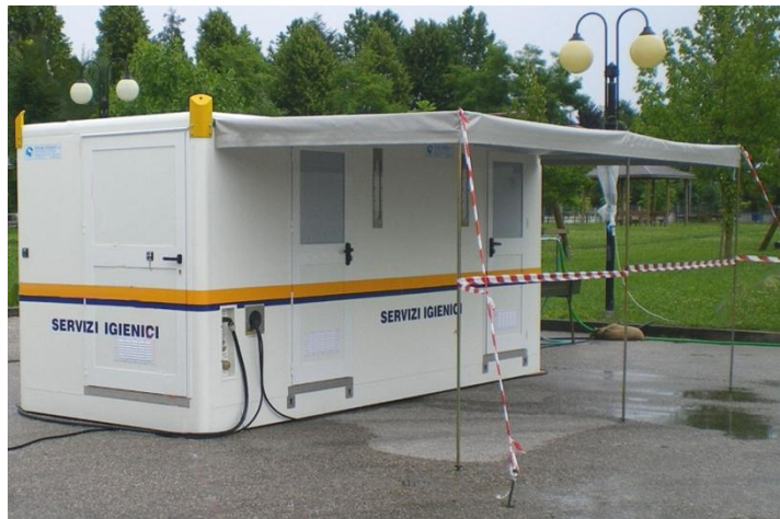
Ansicht des Komplexes mit Blick auf Technikraum und Seitenwand mit Eingängen, am Boden aufgestellt