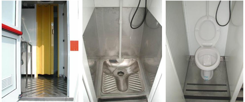
Innendetails: Eingang/Abzweigung - Kabine mit Stehtoilette – Kabine mit „Standard-Becken“