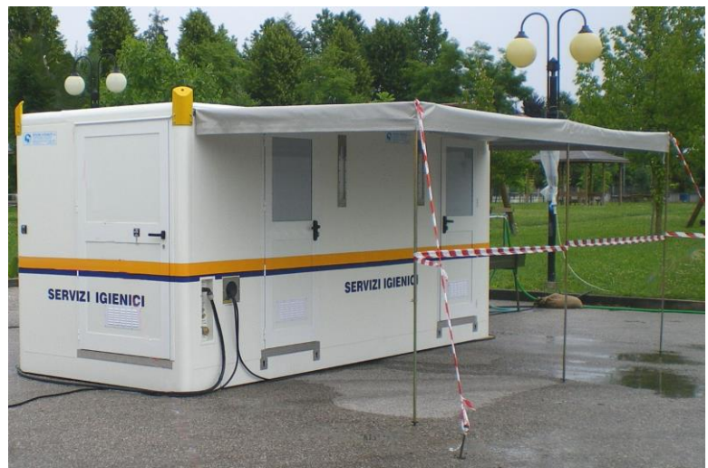
Vista del conjunto sobre ángulo hueco técnico y costado entradas, colocado en el suelo