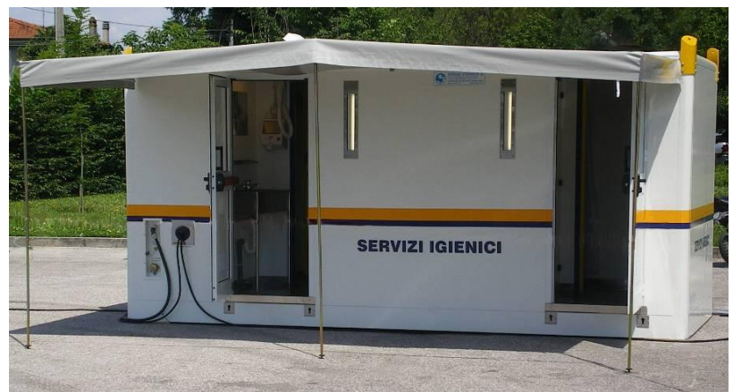
Ansicht des Komplexes mit Blick auf Seitenwand mit Eingängen, am Boden aufgestellt