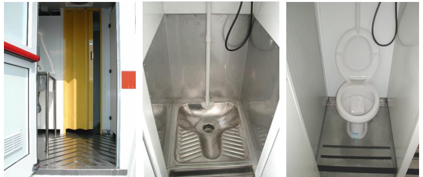
Detalles del interior: entrada/salida - cabina con "letrina" - cabina con "taza de WC estándar"