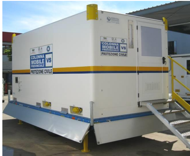
Vista del conjunto su ángulo posterior/entrada y flanco con juntas/enlazamientos