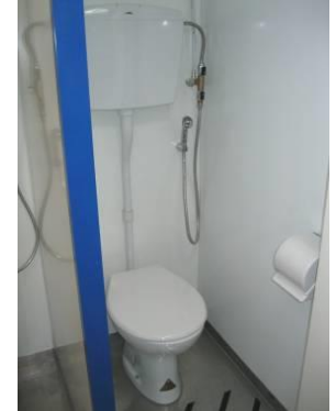
Detalles del interior: a la izquierda cabinas ducha - entrada/salida con lavabo a la derecha - a la derecha cabinas con "taza de WC estándar"