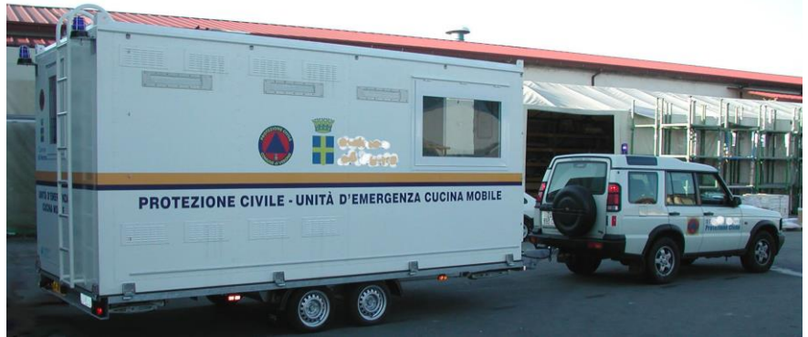
Vista del conjunto desde el lado "distribución", situado en el remolque de transporte