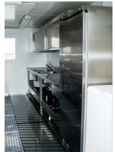
Vista interior del conjunto desde la puerta de entrada: a la izquierda el lado cocción distribución - a la derecha el lato fregadero frigoríficos