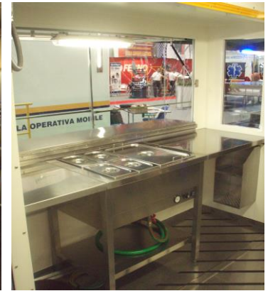
Vista interior del conjunto desde la puerta de entrada y vista interior del sistema de ampliación volumétrica, con "extracción" de la distribución del cuerpo portante, con tarima con escalerilla