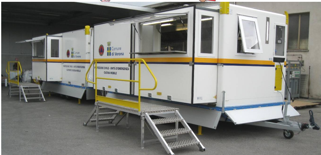
Perspektivische Ansicht der beiden Module in Betriebsposition mit: