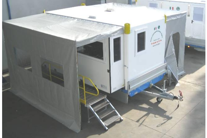
Ansicht des Komplexes mit Blick auf die „Verteilungs“-Seite, auf dem Transportanhänger