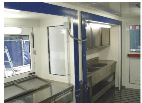
Innenansicht des Komplexes von der Eingangstür aus und Innenansicht des Systems der Raumerweiterung, mit „Herausnahme“ des Verteilungsbereichs und des Spülbeckenbereichs aus dem Trägerkörper