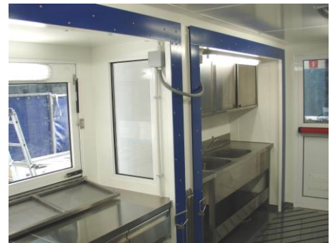
Vista interior del conjunto desde la puerta de entrada y vista interior del sistema de ampliación volumétrica, con "extracción" de la zona de distribución y de la zona de fregadero del cuerpo portante