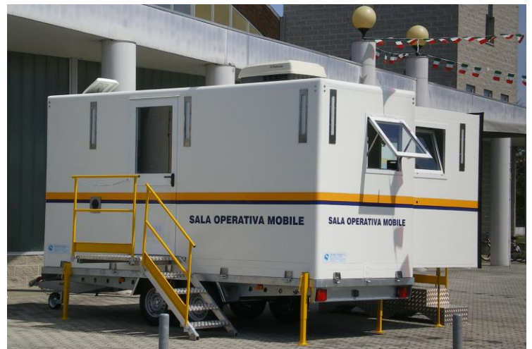
Vista general en posición operativa sobre remolque, zona de entrada de operadores