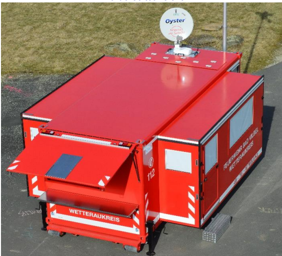
Ansicht von oben