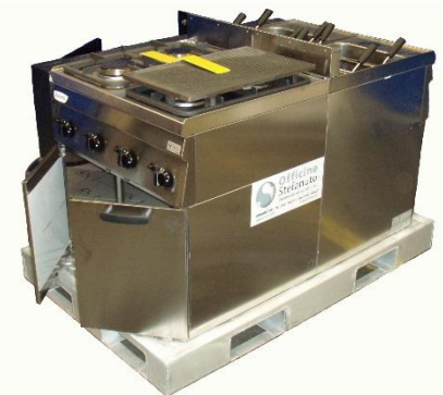
Detail Küchenblock am Boden