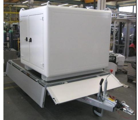
Shelter aus Aluminium auf dem Anhänger aufgebaut