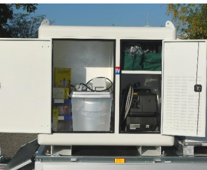
Detail des Shelters mit mitgelieferter Ausstattung