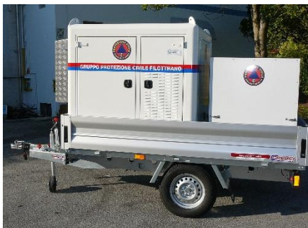
Ansicht der Einheit im Transportzustand