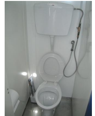
Innendetails: links Duschkabinen - Eingang/Abzweigung mit Waschbeckenanlage rechts. - rechts Kabinen mit „Standardbecken“