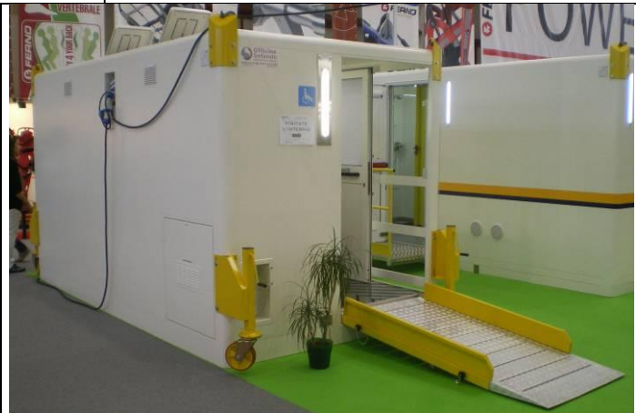
Außenansicht mit Plattform/Rutsche für Zugang