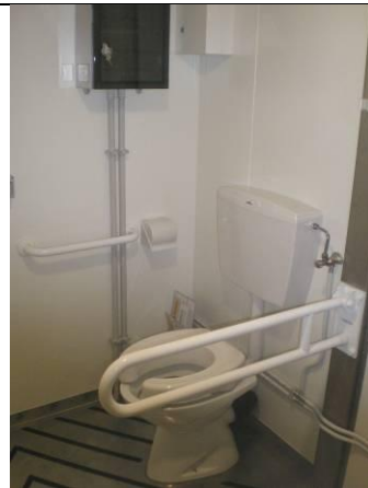
Einzelheiten der Spezialkabine für Behinderte