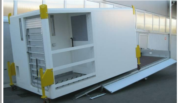
Ansicht des Moduls beim Aufladen/Abladen vom Kipphanhänger