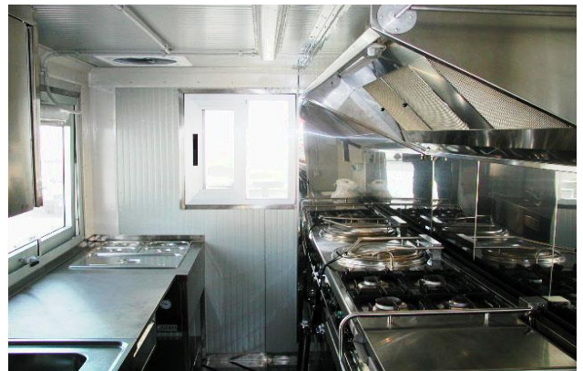
Innenansicht vom Eingang