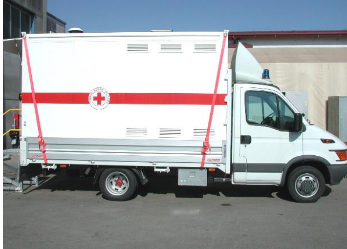
Ansicht des Ganzen, auf Kraftfahrzeug „Daily“ geladen