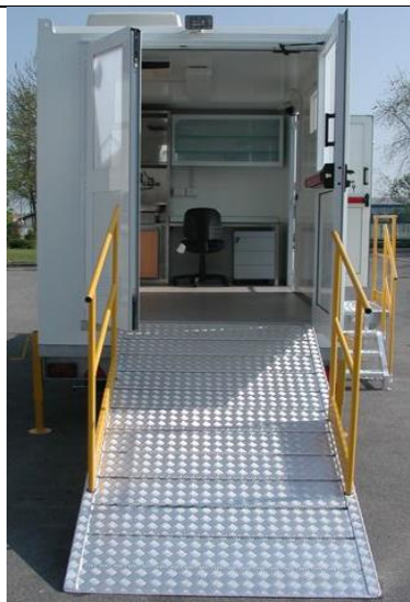
Vista interna dalla rampa per barelle su retro