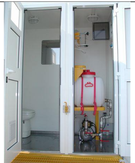
Vista sui vani tecnici anteriori