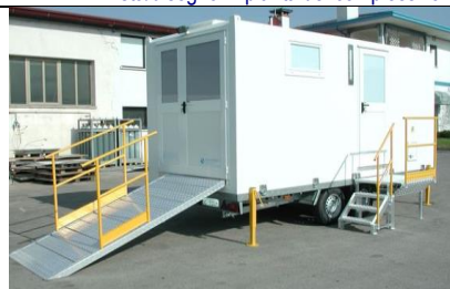
Vista del complesso in operativo da retro