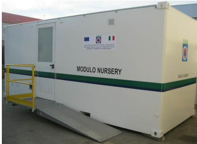
Vista esterna con pedana ingresso