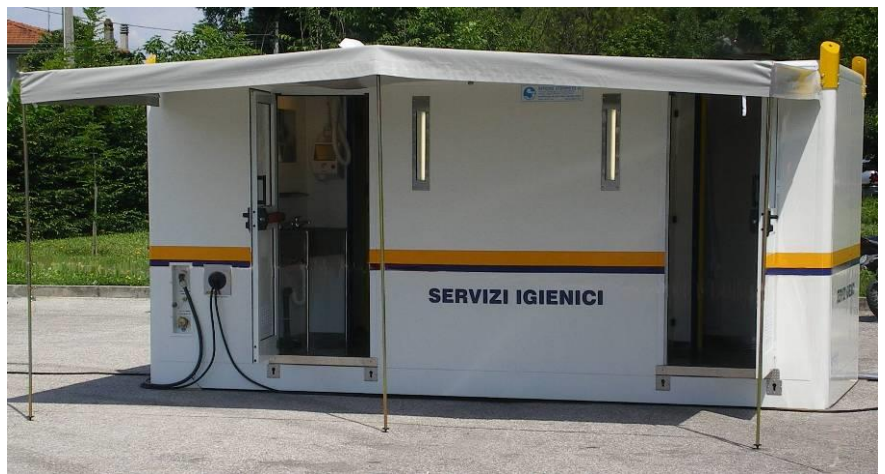
Vista del complesso su fiancata ingressi, posto a terra