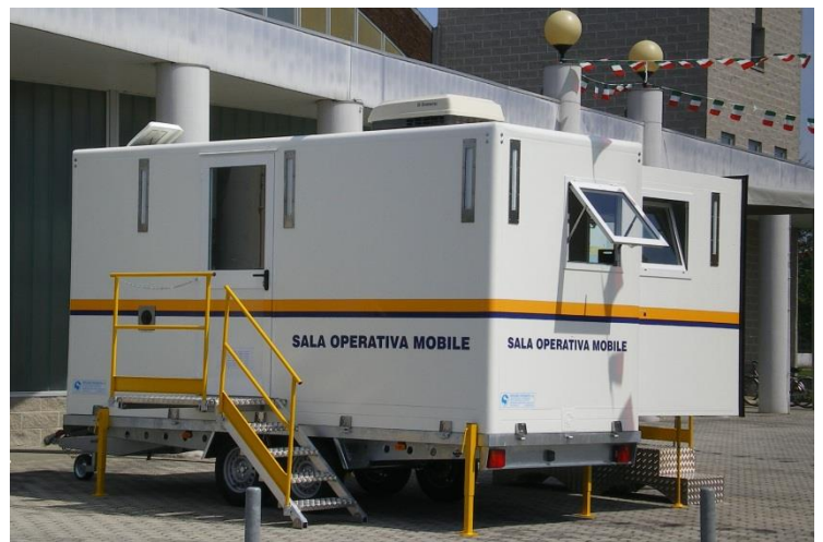
Vista complessivo in posizione operativa su rimorchio, su area ingresso operatori