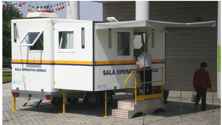
Vista complessivo in posizione operativa su rimorchio, su area d'accesso per utenti