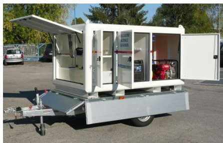
Vista laterale "aperto"