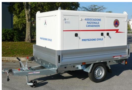
Vista del complessivo in posizione di trasporto