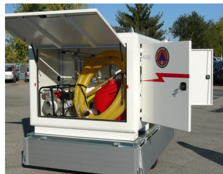
Dettaglio su sportello posteriore